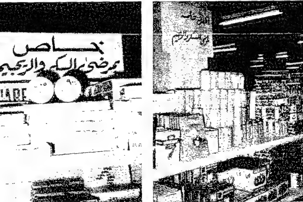
● اغذية الربيجم والسكري بالجمعيات

نعم ان جميع هذه الاصناف بما فيها الشوكولاته غير متوفرة بالسوق المركزي والسبب يرجع الى اعتمادنا على مصدر واحد لتوريد الصنف، فهو الذي يؤمن الصنف للاسواق وللعمرية بطبيعة الحال، مثلنا مثل غيرنا، وانني اعلم ان التعرف على مصدر آخر لتوفير اغذية الربيجم والسكري بشرط ان تتوفر فيها شروط البلدية الخاصة بمرض السلع الغذائية، وذلك حتى تكون لدينا فرصة الاختيار والاعتماد على اكثر من مورد واحد، ونتيجة لوجود نقص في هذه الاصناف على مستوى الكويت فقد يلجأ البعض الى القاطط الفرصة وتوريد البضاعة المطلوبة من بلاد ومصادر اخرى.